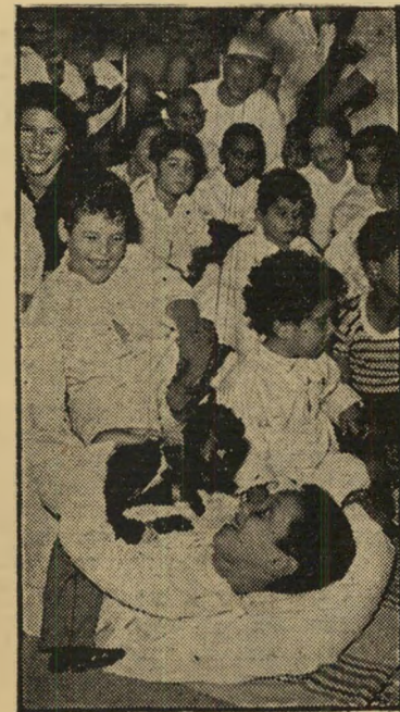
ילדים עם ליואנד האמפטון — חבר שחור

מחקר תעשייתי שנערך בשבדיה גילה עד כמה חיוניים המים לא רק לאדם: להפקת ליטר נפט דרושים עשרה ליטר מים; לשם