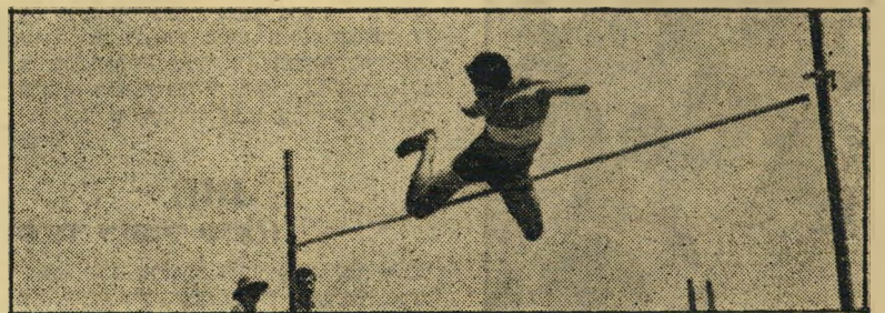
קופץ-גובה ימיני קפיצה שלישית: הצלחה

גב ציבורי, מצא אותו בדמות הממשלה הסורית הנוכחית. יתכן והיה עובר למשק: אולם הוא היה מאוהב דווקא בקאהיר. לכן מצא פתרון מקורי: ממשלת סוריה מינתה אותו לשגריר בבירת מצרים.