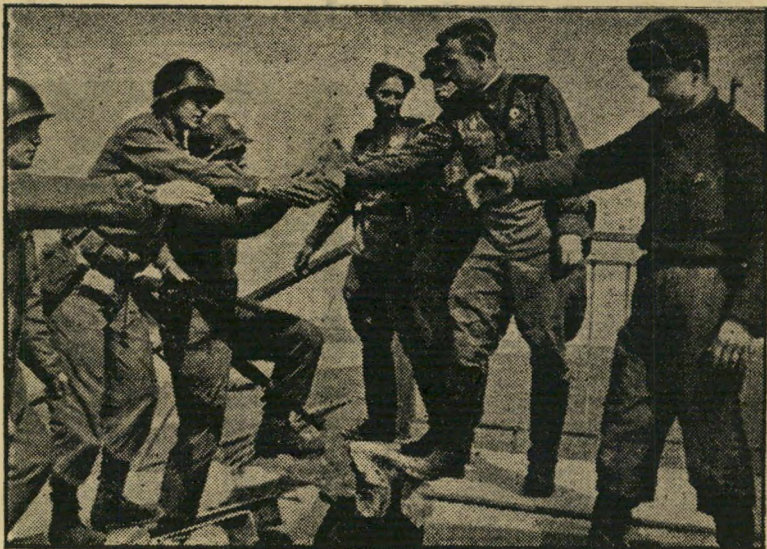
הפגישה ההיסטורית של חיילים יונה עלתה, מניית ירדו

קפיצות למיטה. בשבוע שעבר התעוררו הצנזורים היפאנים, עבי המשקפיים, מתר-