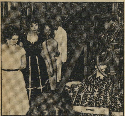
אוריה מבושמת. המלכה, בלוית שתי סגניותיה, ממלאות את תפקידן הרשמי הראשון בשלטון: סיור במפעלי תיא. הן מסתכלות בקנאה בכדי-הבושם הנשלחים לארצה.

א חדות שלחו את תמור נחיהן בפשטות, לא ניסו ל־ תרגם את חיוכן לשפת ה־ מלים, אחרות נהגו כביש־ נות, הוסיפו שאמנם אינן חושבות את עצמן ליפות כל כך, אלא שהחבר (או הבעל) אומר שחיוכה מקסים, ולכן היא מוכרחה... אחדות השי־ תמשו במחוך ממין זכר, ששלח את התמונה, בצירוף המלצה אישית. בסך הכל הן היו 382 נשים, בנות כל ה־ גילים, החל מתלמידה בת 14 מחיפה, ועד אשה בת 37, אם לארבעה ילדים (המחייכת בכל זאת).