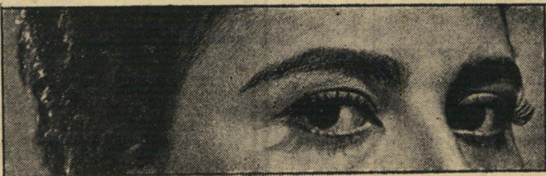
עיני חיה (2) - אש מתחת לחיצוניות זוהרת