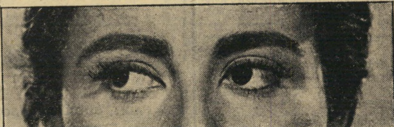
עיני חיה (3) - מבט אובד למחצה