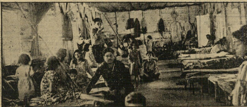
העולים החדשים לא נקלטו (למעלה), הורגלו ללחם חמר. חיפושיו ליוו את הקיצוב שהעניק 85 נקודות לשנה בהן אפשר היה להתלכד כנכר שמימין.