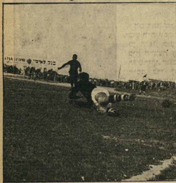
השער השני. חלוצה של קבוצת אתלטיקו מתעה את שוער מכבי תל-אביב, אברהם בנדורי, ומבקיע את השער השני לקבוצתו.

„גאומי“ - פענו אנשי אתלטיקו: „מעורר!“ - התעקשו האכזבים ושיכנעו זאת השופט הגהסס