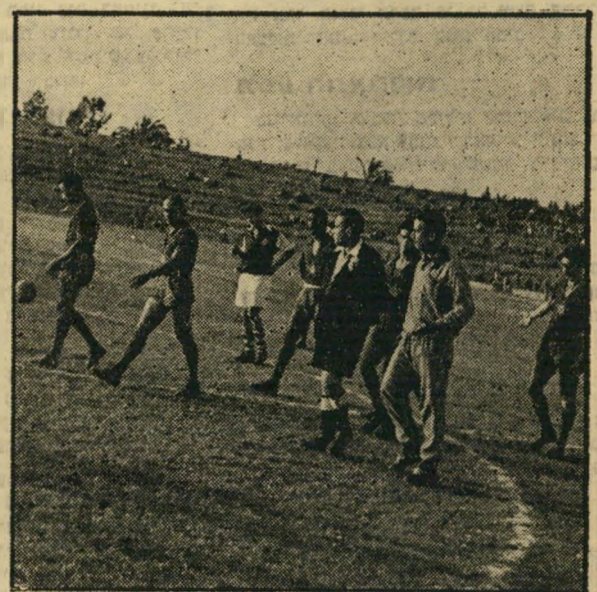
רוצים כדור גומי! עוד רגע והכל יתפוצץ. שחקני אתלטיקו מסרבים לשחק בכדור ישראלי, הסכסוך מחוסל בהתערבות ציר כראזיל

היה מה ללמוד ממשחקם של האורחים — זאת הרגישו לא רק הצופים שחוו במש- חקים מעל קרשי הטריבונות, אלא גם שחקני הקבוצות היריבות, שאורחיהם כמעט ולא השאירו להם מה לעשות על המגרש. אחר שני המשחקים גוכה קהל חובבי ה' כדורגל באיזה ירידה נמצא ענף הכדורגל. שתי