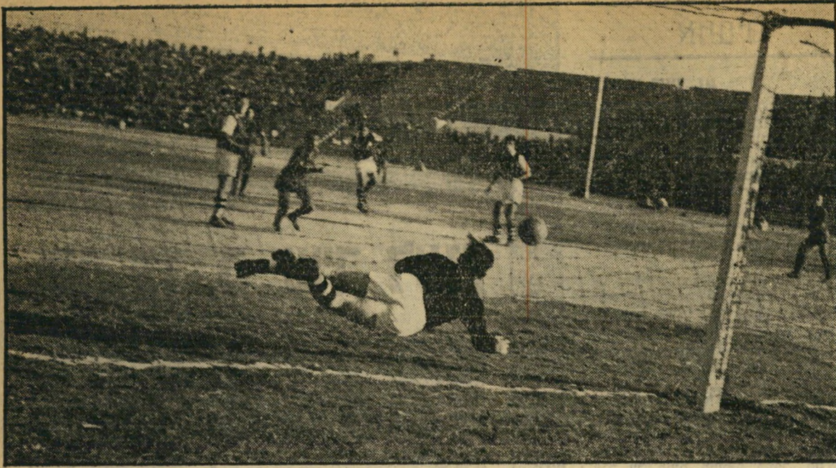
כמעט! השחקן הברזילי עובר את בלמי מכבי, מתקדם אל השער, בוטע בחזקה. השוער מונק, מצליח להדוף את הכדור בקצות אצבעותיו השער ניצל, זמנית, אפשר להרגע ולצפות להונקפה שניה, שהיא לא תאחר לבוא, אם לדון לפי הקצב המסחרר של הברזילאים.

ההתרגשות שעוררה בואה של קבוצת ה' כורגל הברזילית אתלטיקו הביאה קהל רב (20 אלף צופים) למשחקה הראשון באצטדיון הרמת גני נגד קבוצת מכבי תל-אביב. ה' התרגשות פחתה לאחר משחקה הראשון של הקבוצה, שגילתה יכולת טכנית מרובה, איך ובה את הקהל, במשחק איטי במקצת, חסר רוח-לחימה, בפני יריב שלא גילה התנגדות מרובה. התוצאה: במשחקה השני של את- לטיקו, נגד הפועל תל-אביב, במגרש הפועל יפ', הופיעו 12 אלף צופים בלבד, התאכזבו גם הם מנצחונה הקל של הקבוצה האורחת (0:4).