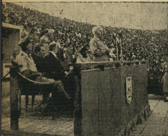
בן-גוריון היה מצויין, לדעתי, אף על פי שאינני שייך לשום מפלגה. אני אוהב לשמוע אנשים מדברים דוגרי, ישר לעניין, בלי כל כרכור-לשון מיותרים.

סימך-טוב גנה עוצר את מכוניתו, יוצא מתוכה ונבלע בתוך ההמון. הוא נראה כאחד מרבבות החוגגים. ההבדל היחיד, הבלתי מורגש כמעט: אות-ארגמן הקטן, הצמוד