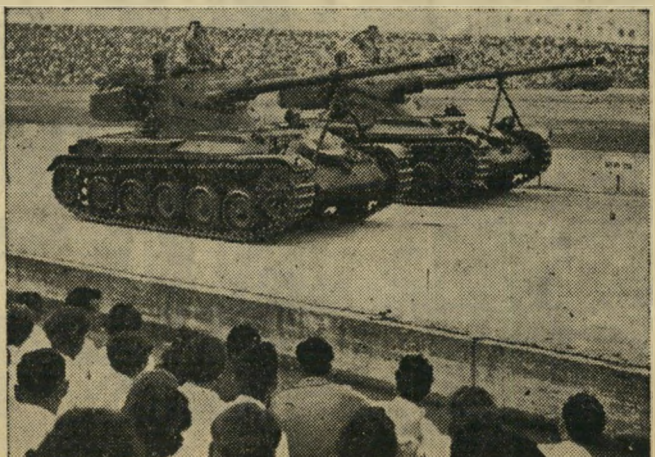
התותח הממונע הצרפתי היה עצום. כל שנה אנתנו זוכים לראות משהו חדש. מתי כבר נקבל פצצה אטומית? הכוונה לפצצה אטומית