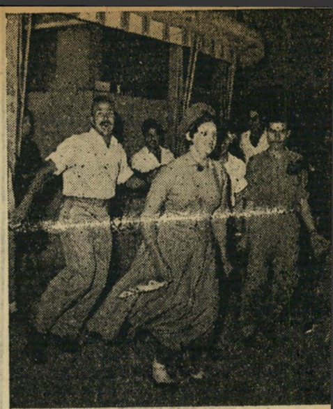
החגים הוא, לדעתי, חג העצמאות. אני אוהב כי באותו יום שמחים כולנו בלב שלם. והרי מעטים ימים בשנה כשיש הזדמנות להיות שמחים באמת.