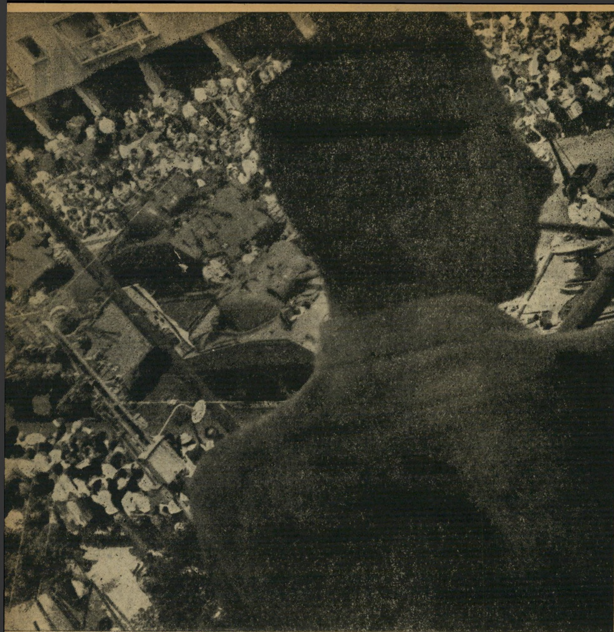
תפסתי משלט עצום על המרפסת של בית-קרובי משם יכולתי לראות את כל המצעד מבלי להזיע ולהידחק. הגייסות המשוריינים שדהרו ברחובות, תוך רעש נורא, נתנו לי להרגיש את מלוא הכוח של מדינתנו הקטנה. אילו היו לנו הטנקים האלה אז, היתה מפת-ישראל נראית אחרת לגמרי והכרוניקה העתונאית בודאי לא היתה מלאה יום-יום ידיעות מרעישות על מסתננים ורציחות.