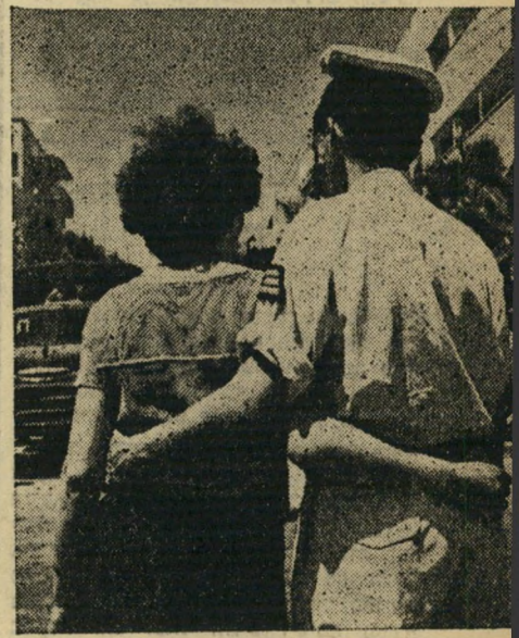
חזוג הצעיר , אשר הלך לפנינו הזכיר לי ולאשתי איך סיילנו ביום העצמאות השני, זמן קצר לאחר שיצאתי מבית-החולים.

אחות מה אני עושה כאן. היא סיפרה לי שנפעצתי קשה. אחר כך בא רופא ואמר לי כי באותו לילה קסעו לי רגל. הוא לא סיפר לי כי קסעו לי את שתי הרגליים. היה לי מה. לא רציתי לקבל אוכל, עד שהביאו אלי נכה אחר, קסוע-רגליים, אשר הלך על פרוטזות, כך שאי אפשר היה להר גיש בשום דבר. רק אז הרגשתי רצון חזק לחיות, לנוע, לכבוש את החיים בכל מחיר.