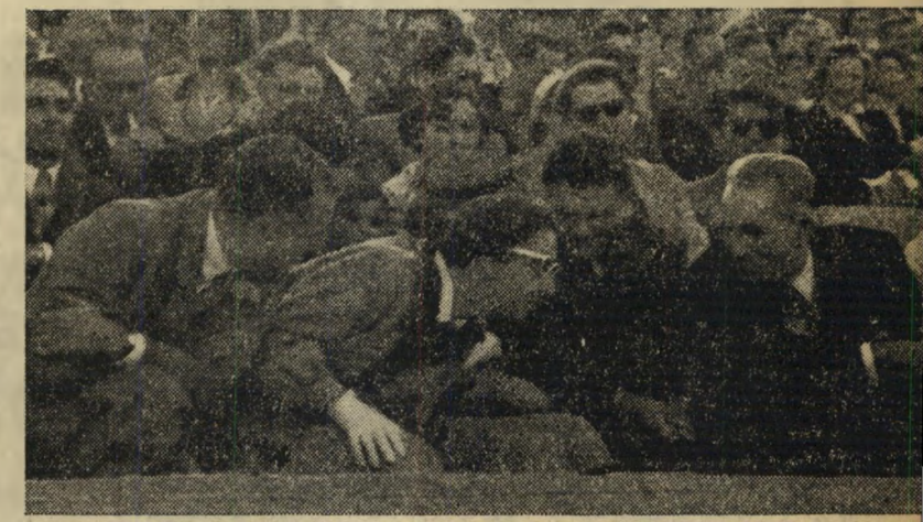
הדיפלומטים ישבו מאחורי, כאשר גינה בן-גוריון את אידן, הסתובבתי והסתכלתי בהם. רציתי לדאות את הרושם שהדברים הנאמרים עושים עליהם. השגריר הבריטי גזן אל השגריר הרוסי, שישב בקרבתו, ושאל אותו בתמהון: "מה? מה הוא אומר?"