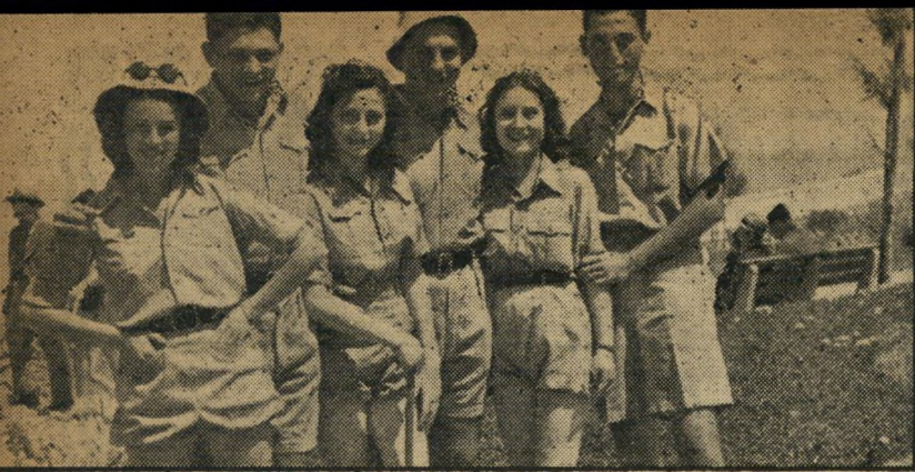
כמריריך בהגנה מסר קוצר (שני משמאל) כל רגע מזמנו הפנוי, גויס לעתים קרובות לשרות מלא בקורסיס, כשהוא חוזר בכל פעם למחזרה בבית-החרושת. מעולם לא קיבל משכורת בהגנה.