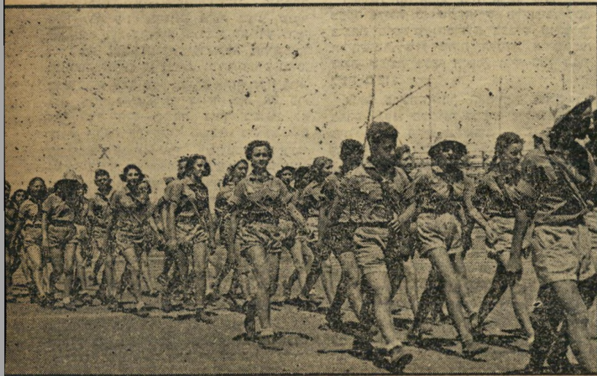
בתנועת-הנוער נוצב אופיו של קוצר (מסומן בצלב), גובשה זמרתו כמפקד. אולט איש