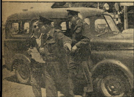
כאשר רצה השוטר לעיין בעצומה, ניגש אליו מפקדו, קצין בעל שלושה כוכבים, אשר עליו לקרוא רח.