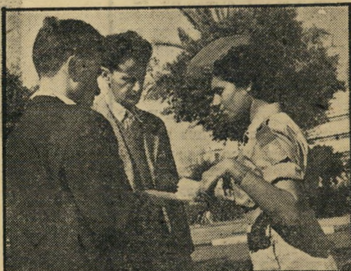
הביעה את נכונותה לחתום על העקרונות הכוללים בעצומה, אך סירבה לעשות זאת, עקב היותה לבושה במדי-ט.

אולם אנחנו היינו במצב-רוח מרומם. הוכחנו את אשר רצינו להוכיח, פנינו לחזור למצרכת.