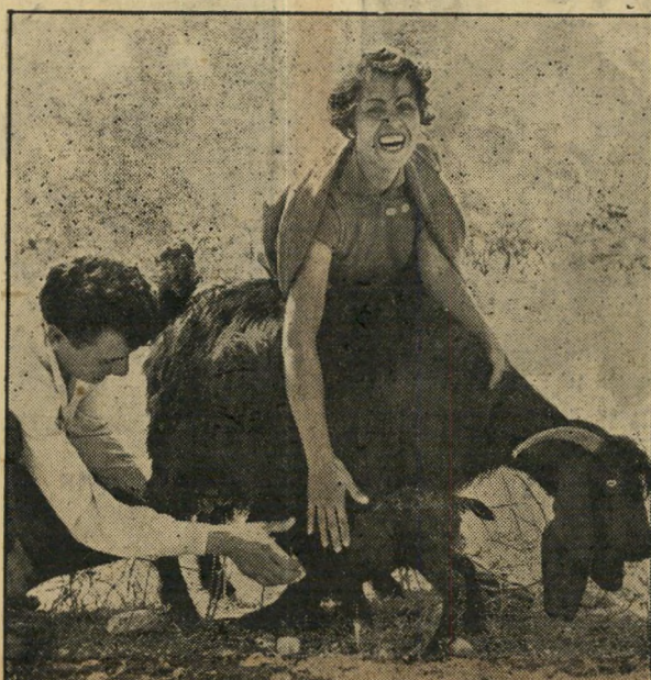
מבצע חינוך. האלמונית מאחוזם איננה חוסכת את חיובם למוז פני העדשה אף כי מסלוח איננה השתתפות מבצע חינוך , כי אם טיסול בטלח בן חשעה, חיונן מעשיני אמה, אחר שקיבל את הטיפול הראשון בעולם הזה, מידי ידית חעיונית וחמסרות של האלמונית.