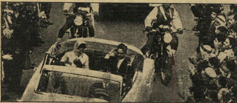
חתן חוסיין וכלתו בעמאן ענין משפחתי