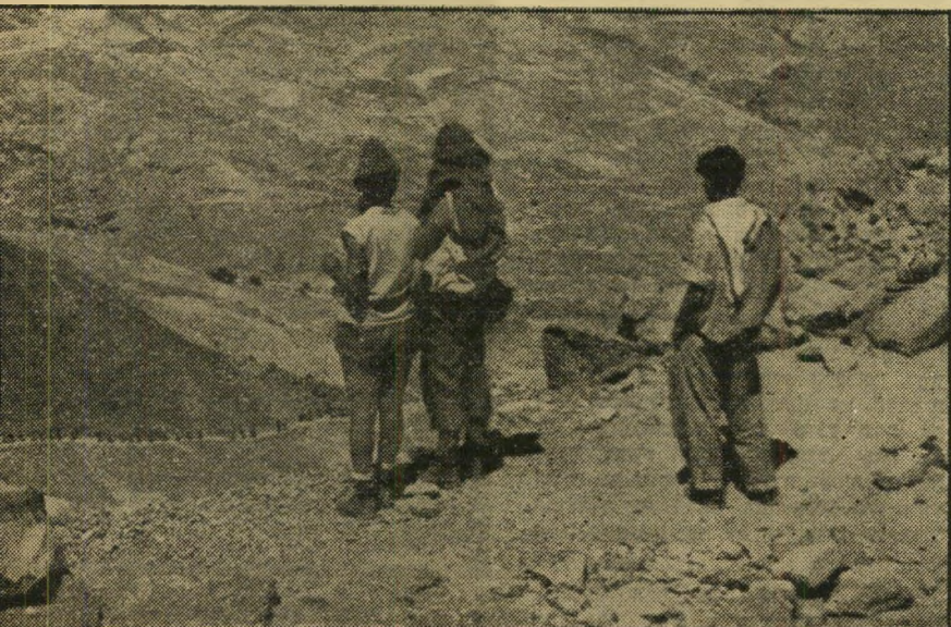
מראש המצדה מסתכלים השלושה. שהגיעו, אל המאות למטה. הנמצאים עוד בראשית דרכן. זהו הצד השני, המערבי של המצדה. הכינן אנתנו נערכו הרומאים לקרב המכריע על