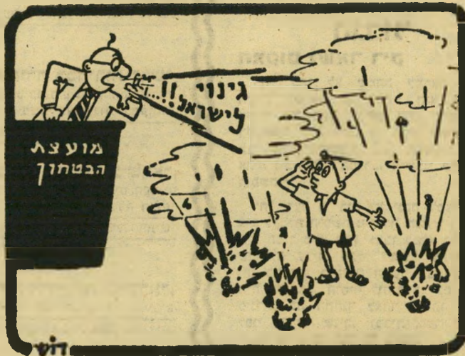
יותר בקוד רם: אינני שומע!

כל אחת משלוש הדרכים האפשריות האלה סותרת את רעותה. אולם לאור כל אחת ואחת מהן רעיון-התגמול הוא אחילי ומויק. הוא מאפשר לאויבי ישראל להכתוב לה את דרכי-לחמתה. והוא מאסר למנהיגי ישראל ערב הבחירות לביים ביניהם ויכוח-יסיק במקום שלא קיים בו אלא אסטרטגיה מחשבתית משותפת.