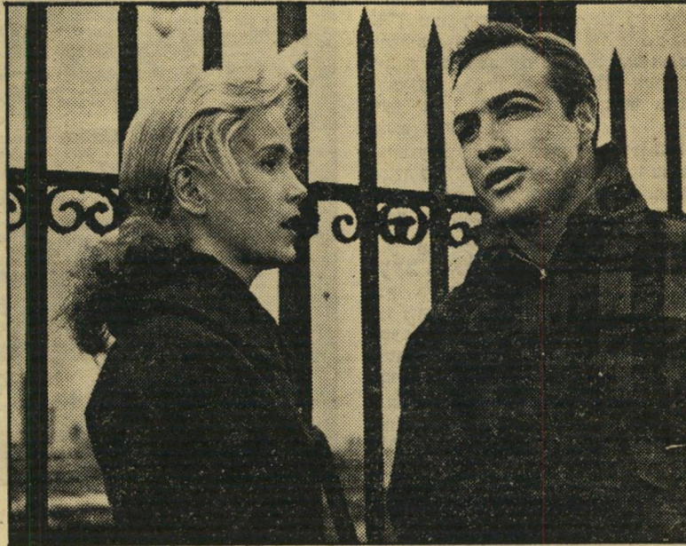
בראנדו עם אווה מארי סיינט ב'חופי הכרך'...

בהתכוננו לתפקיד נפוליון בסרטו האחר' רון דוירה השקיע שוב בראנדו עבודה רבה כדי לגלות מה פשר התנועה המפורסמת של המצביא המהולל, שנהג לתחוב את ידו הימ' ניה אל תוך חולצתו, גילה לבסוף לתדהמתו כי הסיבה היתה פרוואית מאד: בתלבשתו של נאפוליון לא היו כיסים כלל.