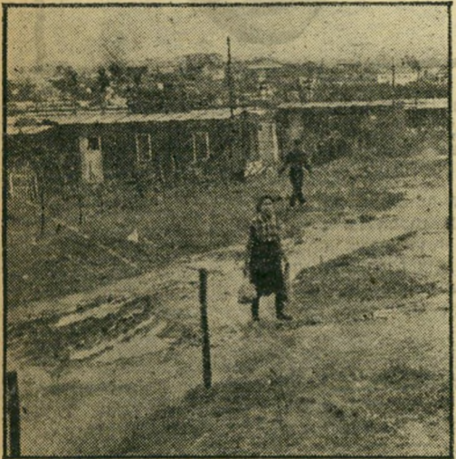
הדרך הסמלית. הבוג הטובעני במעברה, מסמל בעיניה את כל הקפאון שבחיי המעברה. היא שואפת לעזוב את המקום.

הרחק, מעבר לים. לפתים קרובות היתה הילדה הקטנה מנסה לאמץ את עיניה ולשלוח את מבטה אל מעבר לאופק, אך ארץ היהודים לא נראתה לעין.