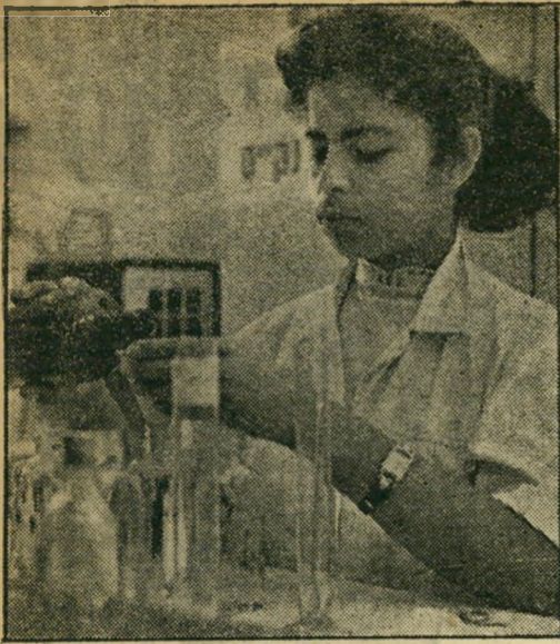
דרכי החיים. מזל עובדת כעוזרת באחד מבתי המרקחת של בני ברק, שוטפת בקבוקים ומשתתפת בכלכלת משפחתה.