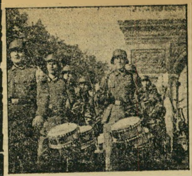
הם נולדו כאשר הנאצים כבשו את פאריס

בני 15 אינם יוצרים אידיאלים. הם פועלים על פי האידיאלים אשר המבוגרים, האבות והאחים, מספקים אותם. אם חסר היום בנוף האנושי של שנתון 1940 האידיאל האחד שהוא מרכיב