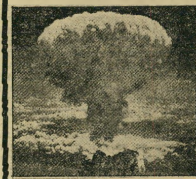
הם הלכו לגן כאשר שינה האטום את העולם