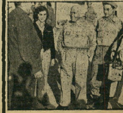
הם היו בכיתה ה'