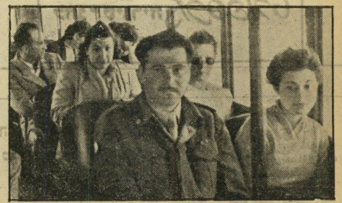
יום שני, 29.3.55

אתה, אחד מאלפי הנוסעים מדי יום בקו הישר תל-אביב לחיפה ומחיפה לתל-אביב, אותו מקיים אגד בדייקנות, נוחות ומהירות תוכל גם כן לנכות בפרסי הזיהוי. לנוסע הראשון בתמונות שלמעלה שיבוא ויזהה עצמו במערכת העולם הזה, תל-אביב, רחוב גליקסון 8, יוענק פרס של 15 ל"י במוזמן. השני במוזמן יזכה בפרס של עשר ל"י במוזמן.