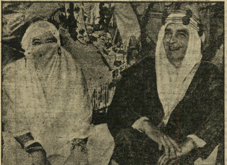
שנריר ביורוד ואשתו הפנים מסתירות, המטיכה מגלה

אתה, אחד מאלפי הנוסעים מדי יום בקו הישר תל-אביב לחיפה ומחיפה לתל-אביב, אותו מקיים אגד בדייקנות, נוחות ומהירות תוכל גם כן לנכות בפרסי הזיהוי. לנוסע הראשון בתמונות שלמעלה שיבוא ויזהה עצמו במערכת העולם הזה, תל-אביב, רחוב גליקסון 8, יוענק פרס של 15 ל"י במוזמן. השני במוזמן יזכה בפרס של עשר ל"י במוזמן.