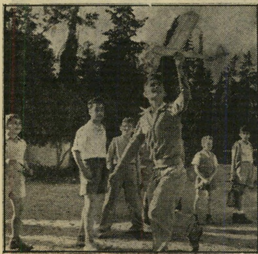
קנאת הילדים. בני הכיתות הנמוכות מסתכלים בטיסן שהתפעלות. הם חולמים על היום, בו יהיו גדנע-אוויר.

פעם נשאל סיני מה יעשה אם יזכה פתאום באלף לירות. הוא ענה בלי היסוס: "אקנה מנוע קטן לטיסן, ספרים על טיסנים וחומרי-כ"א יישאר משהו יבקר, מן הסתם, בקולנוע. קצת בילוי לא יזיק, לא לסיני, על כל פנים.