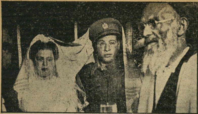
חתונה צבאית בכננוזי — חייל ארצישראלי וצעירה יהודית מקומית