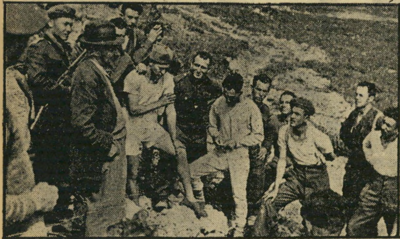
משה שרת עם חיילים (לבושי תחתונים) בחזית איטליה