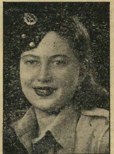
חיילת ארצישראלית בא. ט. פ.

בשתי רבבות בחים ישראלים השבוע הוא שבוע חג. פועלים ופקידים, אנשי התישבות ואנשי עסקים, שהצעיר בהם הוא עתה בן