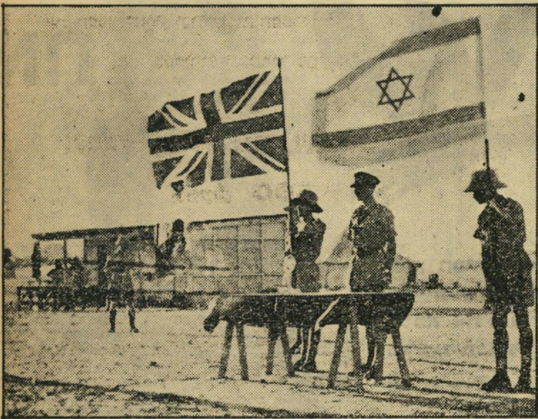
הרנע ההיסטורי: הנפת הדגל העברי במדבר בניגוד לפקודה