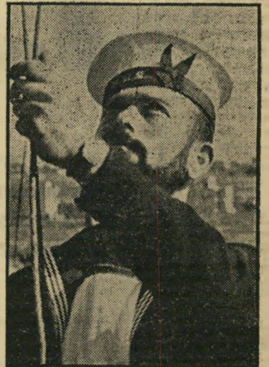
ימאי ארצישראלי בצי הימי לתוך קנקן ישן, יין תוסס חדש

28 והמבוגר מעל ל-50, יוצאו מהארונות מעילים ישנים, עטורים שורות של אותות, שפורזו על-ידי הצבא הבריטי ביד רחבה. חמש-עשרה שנים אחרי שראשוני הארצישראליים, יהודים וערבים, עמדו בתור בי בית-הוד התלאביבי, כדי להתגייס לגדוד הראשון של חפ"ש ארצישראליים (מס' 601), ועשר שנים אחרי שיחידות יהודיות שונות הוכרו כבריגדה יהודית, חוגגת המדינה את חג ההרנדבות.