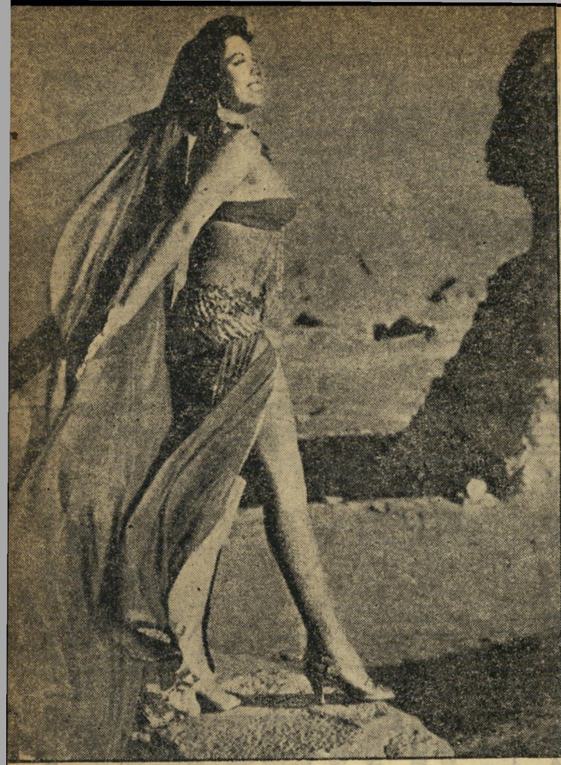
כוכבת הקולנוע המצרית סאמיה גאמאל היתה ממקורביו של פארוק. מאז עזבה אותו, נישאה למיליונר סקסאסי, התגרשה, ניסתה מזנה בהוליבוד, נכשלה, משתתפת בסרטים צרפתיים.