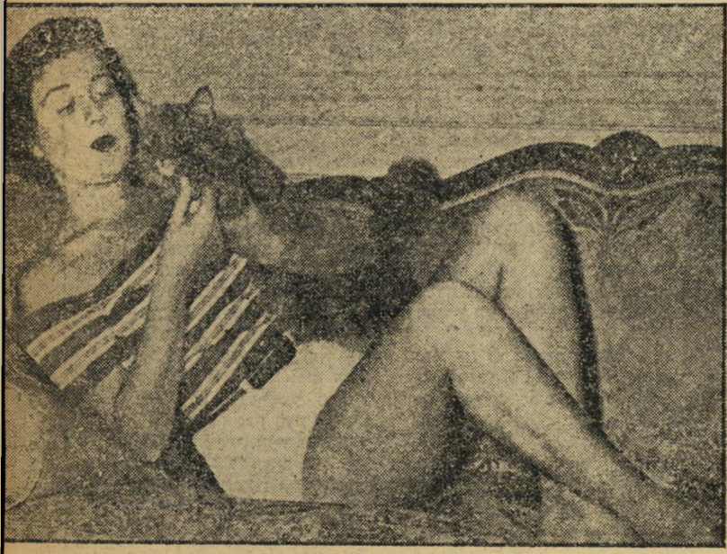
הנערה התמימה , מימי מידארט, ביתו של מלך הנקניקיות האמריקאי, היתה, על אף שש" עשרה שנותיה, כדור-מישחק בידי אביה וטוכן פירסומת אורלאנדו, שהפיצו שמועות על קשריה עם אצטרוס השני, לב פניה עם ספרים חבטנים עד מימינו עובדה. ספרים כי אינו לב כשנוכח

לקוראים כי יש לך רשת גדולה של מסעדות. מובן מאליו שהמוני אמריקאים יתחילו ללול את הנקניקיות שלך."