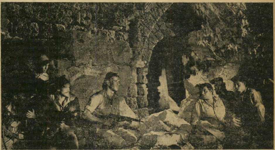
בשער ציון מתכוננים הפורצים להתקפה המכרעת. המצלמה מצרפת כאן שורה נהדרת של טיפוסים ישראליים. הגבעה נכבשה. קצין או"ם מוציא מידי גופת החיילת את דגל ישראל.