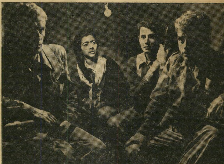
בדרך לגבעה יושבים הארבעה, צבר, אמריקאי, תימניה ואירי נוצרי, במכונית המשא. התפקיד שהוטל עליהם הוא לתפוס גבעה 24, לפני היכנס האפוגה לתוקפה.