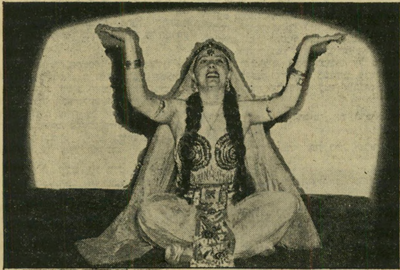
רקדנית לנסקיה גם בן גוריון לא נעלב

כשהכינו בשבוע שעבר חיים (חפר) ודן (בךאמז) את ילקוט הכוזבים השבועי שלהם