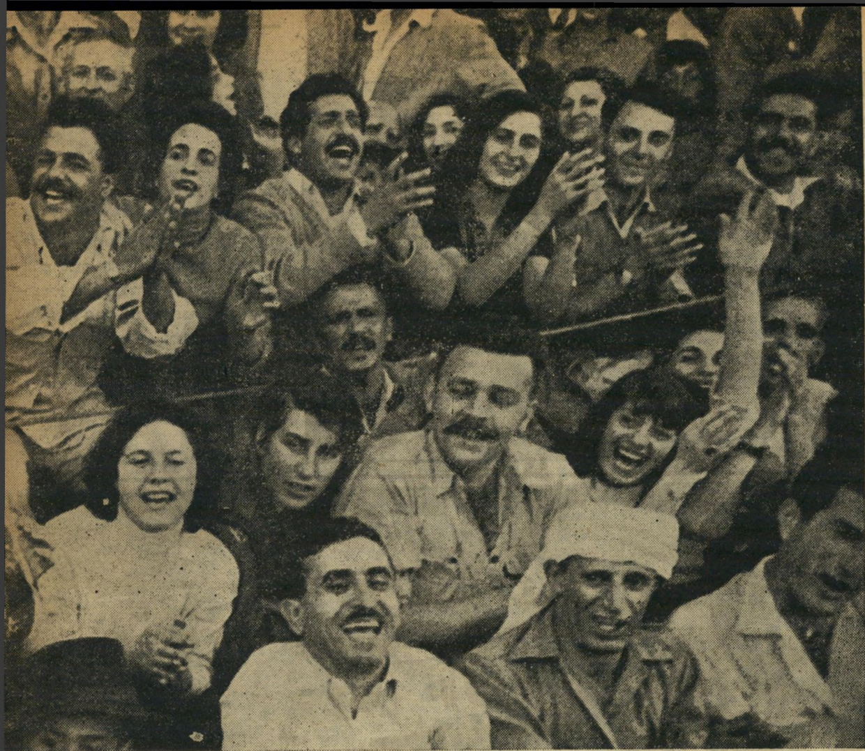
מחאות-כפיים סוערות קיבלו את פני חיליהתפאורות (למטה). בין המרעים אנשי חבורת האש, אשר התרכזו לאורך גישביינים (למעלה).