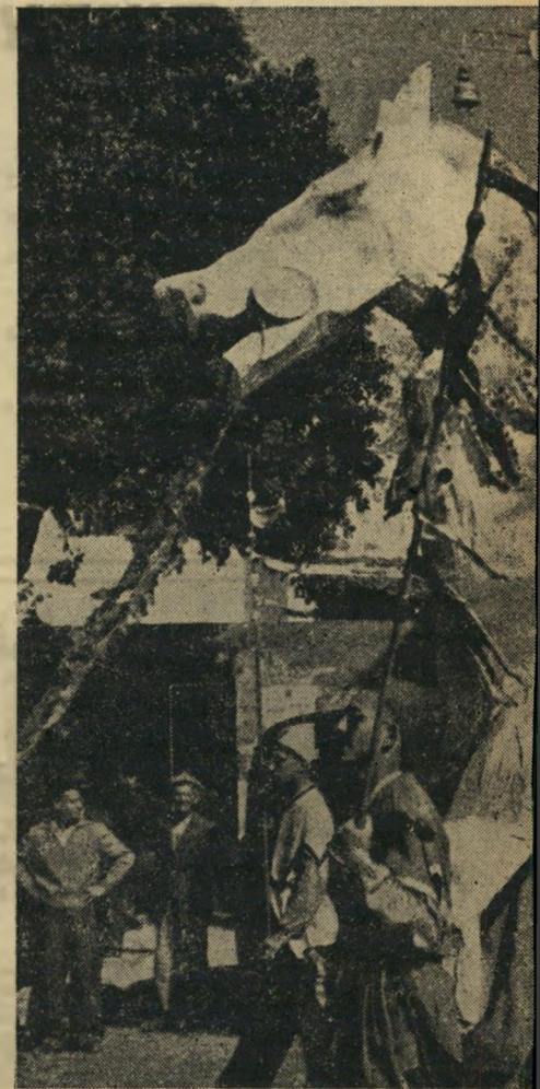
אש עיריית תל אביב, חיים לבנון, אשר הפך את מסורת י כל עדלאידע, פינה את מקומו לזקן השומרים, אברהם מעלה) היה בובת מרדכי היהודי, המובל על ידי המון. בין ראים (למטה), שופקו בשפע על ידי עולי דרום אפריקה.