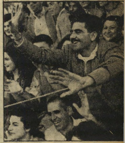
הגיל איחד את כל הגילים, לא הבדיל בין הסבתא (משמאל) לצעיר הנלהב.