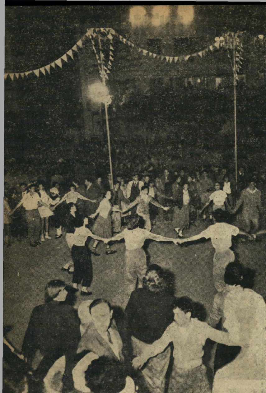
מיכר דיונגוף , שהארה מסיבב בזרקורים חזקים, התמלאה נוער. המזרקה המוכרת לא נראתה: הברכה כוסתה קרשים, הפכה לרחבת ריקודי-עם, שימשה זירת מפגן לתנועות הנוער.

אף על פי כן היו הבתים עמוסים בני-אדם, שהמינו בלהיטות להתחלת התהלוכה. רבים מהם תפסו מקומות נוחים עוד בשעות הבוקר המוקדמות, אף על פי שהם לא נתנו שינה לציניהם בלילה הקודם: "לא נורא. כאשר הכל יגמר, ניכל לנוח כהגון."