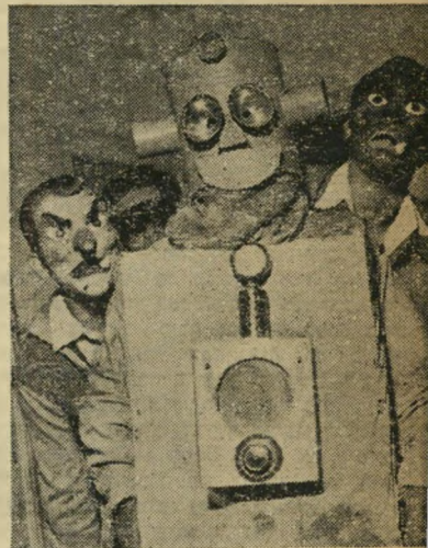
אישה-מאדים וחבריו התפלאו על יחס המוזר של חברי קורקוסיקלן לכוש.

לא היה אפוא כל פלא בכך שכל הדרכים הוליכו בשבוע שעבר תל-אביבה. פלגים ארוי כים של כלירכב שטפו מצפון, מזרח ודרום אל תוך אגם העיר הגדולה בישראל. ירו שלים, טבריה, באר-שבע, התרוקנו והפכו לערי-צלים.