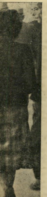
היא יוצאת כעדה הנאשם חיתרה על עדותה.

בלת-אכבי, כשומר-לילה, והיו לנו הרבה הזדמנויות להיות יחד. אלכס התנהג אתי בעדינות, אמר לי שהוא אוהב אותי ויקח אותי לאשה. הוא לא הסתיר ממני שאמו ואחיו אינם רוצים שהוא יישא אותי. הוא היה מלא מרירות, אבל הוא לא היה מסוגל לעשות דבר. אלכס היה בחור טוב, אך חלושי-אופי. הוא עבד קשה בנגריה, בקרבת העיר. היתה לו משכורת לא רעה: 120 לירות לחודש. זה היה מספיק כדי שנוכל להיות יחד. אבל אמו לקחה ממנו את כל הכסף, השאירה לו רק דמי-כיס.