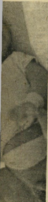
הילד הוא מסור לידה