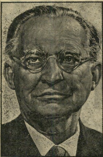
דהדיאספרי — במהדורה שניה

האטלנטית, בהידוק היחסים בין המדינות המתנגדות להשתלטות הקומוניזם. כאשר רצה פללה לדעת מה הן תוכניות התורכים לגבי המרחב, מילאו פיהם מים, הסכימו כי הברית האטלנטית והסכמי ההגנה האירופיים הם בעלי חיוניות.