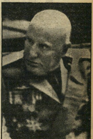
מוסוליני — חרב האיטלאם