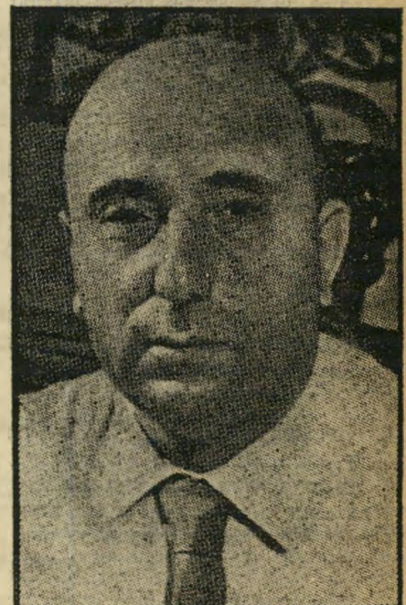
שלבה — באותו בנין