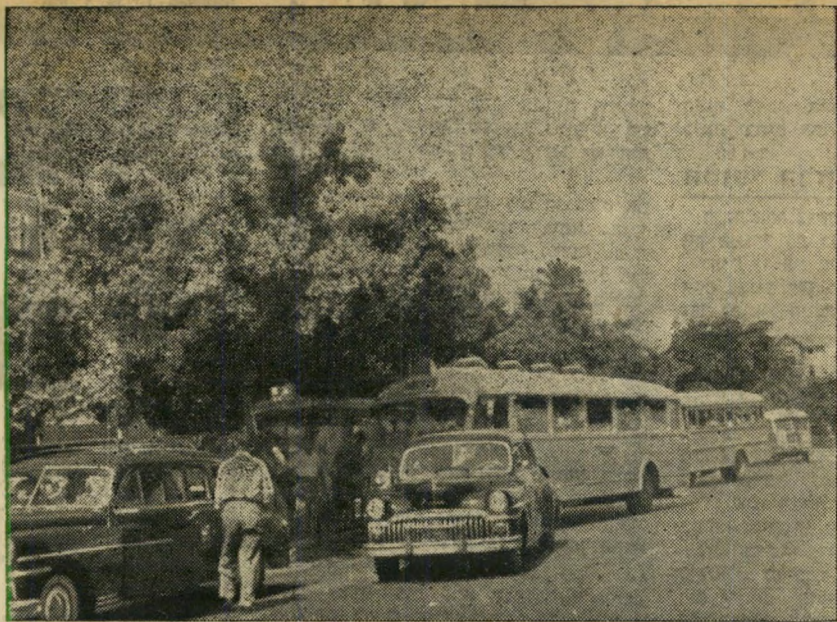
החוק האוסר חניית כלי רכב אחרים בתחנות אוטובוסים, מכוון לאפשר לתחבורה הצבורית תנועה ללא תקלות. פריצת החוק הוזה ע"י המוניות הפכה לדבר קבוע. תופעה זו, אם לא תחוסל, בהכרח תחזיר את התחבורה אל "ימי הביניים" שלה.

החקירה הופסקה. החקירה הפלילית נפתחה, אך הופסקה באורח פתאומי. חוקרי המשטרה תמכו בדעת אנשי הוועדה המיר, חזתה, שהגיעה למסקנה סופית: פיטורין של שטנר היו מוצדקים, ובהאשמותיו לא היה שמץ של אמת.