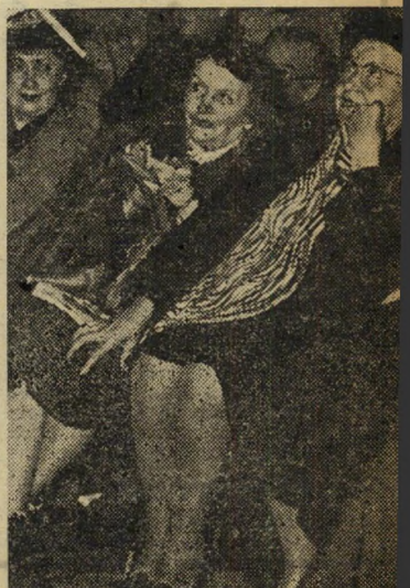
גריפה. קצב הג'אז גורף עמו את כולם, ידעי מוסיקה ושאינם יודעים.