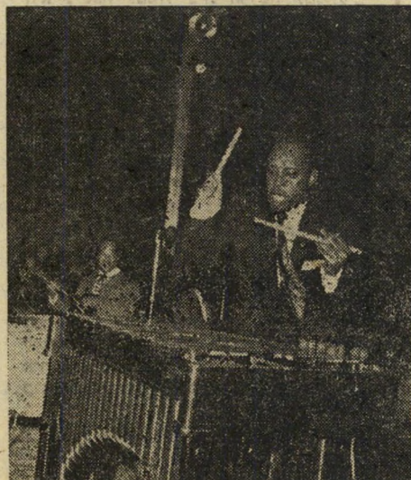
סחיפה. מלך הג'אז מקיש על כליו האהוב, הוויבר'פון, והקהל נסחף אחריו, כמו עניבתו האדומה.