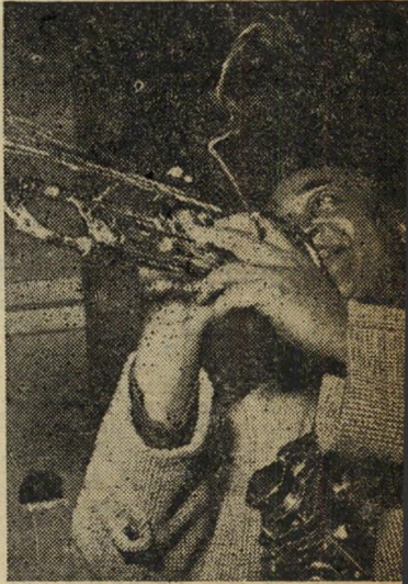
בחינה. ככל חבריו, לא נוטש גם הוא כליו, בחנו בין צילום לצילום.