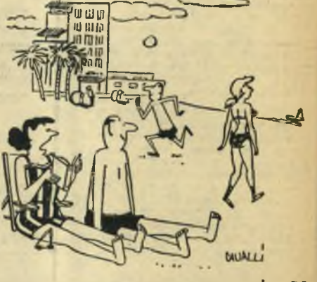
א. "למה אתה מתכוון, שמעון, בשאתה אומר שאתה נהנה לראות נשים חכניות?" ב. "מר כספי, באמת, למה דך לגרום לשינוי קשיים מיותרים?" ג. "לא לכה אחד הייתי משכירה חדר זה, מר ספנסר. זהו המקום בו יצא בעלי מדעתו."