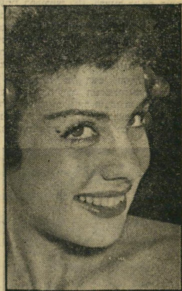
נערת-זוהר שפיר לשינוי קל, ניתוח פלסטי

מבסס תורת-הגזע בדרום אפריקה, יוצר האפרטהייד (הפרדת הגזעים) ולשעבר ראש ממשלה דניאל מולאן , נרשם בספר הזהב של הקרן הקיימת לישראל על-ידי יהודי ארץ צה, תוך ציון לא-הולם ביותר: "לאות הוקרה על תרומתו לשיפור ההבנה הבינ-גזעית בדרום אפריקה". להוקרה שונה זכה סיר ווינסטון צ'רץ צ"ל על-ידי יהודי גלסגאו הסקוטית. הם החליטו לתרום אמבולנס שישא את שמו של סיר ווינסטון, למגן דויד אדום בישראל.