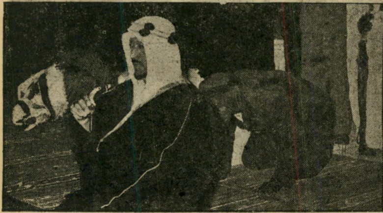
האמיר נאיף (כורע מימין). צעירה מישראל

בין רבבות הסטודנטים של אוניברסיטת קליפורניה מצויים כ-3000 סטודנטים זרים. שני הגושים הגדולים בין הסטודנטים הזרים: הערבים (400 איש) והישראלים (200). בין יוצאי שמונה ארצות ערב לבין הישראלים לא שוררת ידידות יתירה, אם כי הם נפגשים