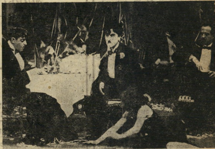
מסיבות אלה מצטיינות בזריחה אינסופית של מאכלי-מלכים ומזונות פשוטים, החופפים לראי צ'רלי הבולעים ומולעים, עד שקץ בהם. אין צ'רלי רגיל להופעות האומנום שלאחר הארוחה והוא מנסה להציל רקדנית מופת-לנכוכי מבחיונה המתעלל בה ללא סיבה. רעב לסינאר וולתו. המושלך