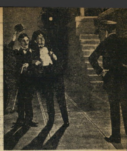
יד לקח מתחת לגשר ופגש במליונר לא מציל אחרי שחלה מנסה להתאבד. המליונר, מביא את צ'רלי לביתו הארמוני, מאכילו, משקן ומלבישו למורת רוחו של המשרת הרואה בעין רעה את ההתיידות. ונחים על מדרגות הבית, עוברת הנערה העיוורת.