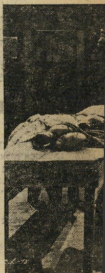
התאגרפות, מקבל הכושי, מדגים קץ לקרירה האגרופנית הצעירה. בזירה מתנגד צ'רלי כמשתמט אמיץ הנלחם בריגב שומה, אך המוצא לבסוף חצי-מת. שטרם נואש כליה, מנסה בוחו כאוסף-אשפה.