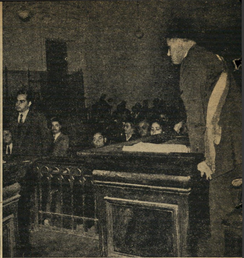
בית הדין הצבאי. שלישי מומין: אביבית-הדין בריגדיר דיגווי.