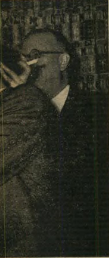
הנשיקה שלא ניתנה: הכוכבת התי