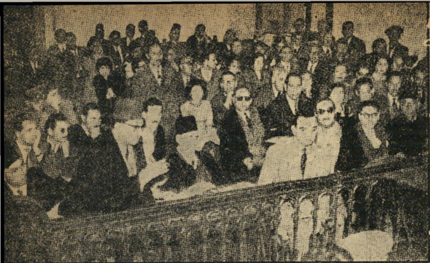
שורת הפניגורים והקהל באולם בית המשפט

עשרה גברים וצעירה אחת ישבו כתא המסורג של אולם בית המשפט הצבאי בקהיר. ההאשמות נגדם נשמעו משונות, שייכות יותר לפוליטון של ילדים מאשר לעניין של חיים ומוות. אך לממשלת מצרים לא היה איכפת. היא התעלמה מהתנצחויות ישראל ואיומי ח-כיה, מהתערבות משלחות זרות ומאלפי מברקים: המשפט היה דרוש לה לצרכים פנימיים.