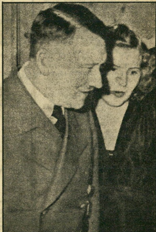
היטלר ואשתו אוהה בראון, בובה אינה לוסקת בפוליטיקה

לבריחתו של היטלר מן הנישואין היתה סיבה אחת, רבת־חשיבות: הוא התעמק בחקר תורת־הרשה, הגיע למסקנה שגאון כמותו לא יוכל להוליד בן גאוני, אשר יירש את מקומו