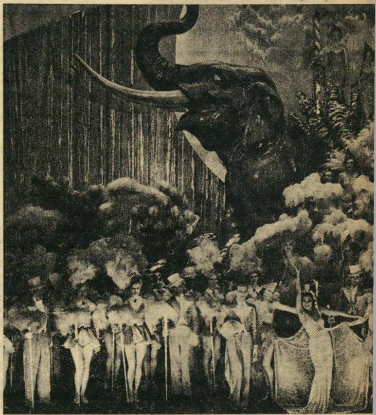
תמונה היתה ג'וזפין (מרכז) מוקד ההופעה, ככתמונה זאת משנת 1937.