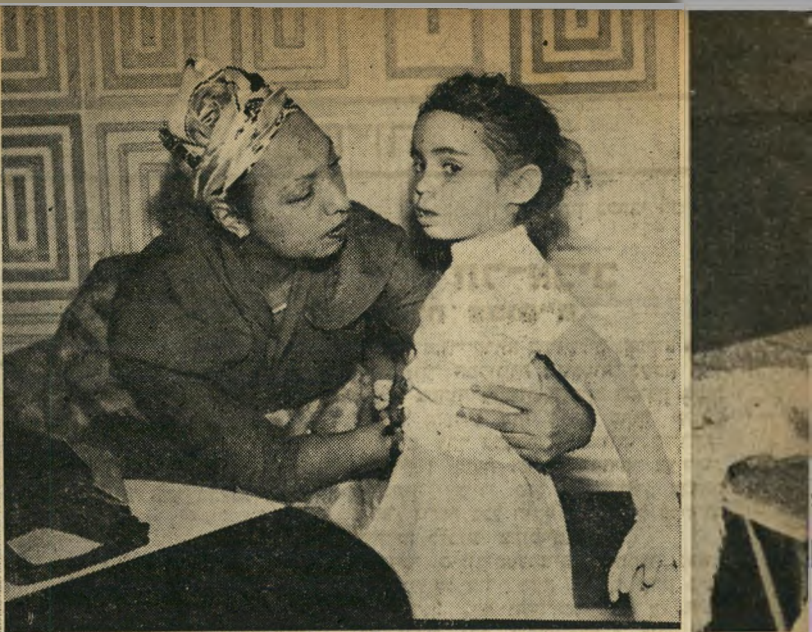
מפורסמים. ירידה : ג'וזפין מחבקת ילדה תל-אביבית שהגישה לה פרח.