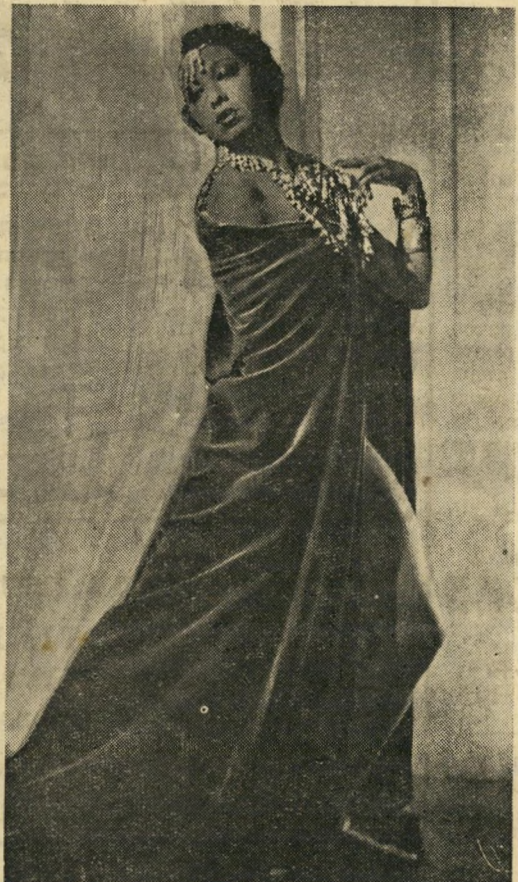
הרגל : בת הלווייה הקבועה לשירת ג'וזפין מת' בלסת באצילות זבעדינות קויה מבין שמלתה. ג'וזפין משמשים כשגריר רצון טוב.

אחד או יותר מששת ילדי אימוציה. בין בן, יליד אפריקה המערבית בן 11 החו" שזה ז'ארי, ילד פינלנד בן השנה, עמנו דיאני הקטן מפרו (13 חודשים), ז'אנו (14 חודשים), ז'אן קלוד הפאריסאי או אקיו, הבכור, יוצא יפאן בן השני החליטה לא להסתפק בששת בניה ה" ילם יתומים שאימצתם, מחפשת אחר , כדי להשלים את מספר בני משפחת למספר הקסמים, שבע. היתה מתנגדת לגמרי לכך שיהיה זה ל"אביב, או משה ירושלמי. מרחיקות-לכת באביב מיפיעה ג'וזפין ערב-ערב בזירת-הענק טרון ברמת-גן, כשהיא מלווה תזמורת, אחת מחמש הלשוניות בהן היא כפי ובת לומר, "יודעת להיות מובנת". כש" הארוכות והצרות, הצבועות בלכה או יחורת לפנייה. יחד עם רגליה החטובות לתפארת, שרה הפצצה השחורה בצרפתית ובאנג' לית, בספרדית ובאיטלקית (היא יודעת לעשות זאת גם בגרמנית). ארבעים וחמש הודקות בהן מופיעה ג'וזפין פעמיים בערב אינן הופעה בייקריית סתם. היא גם אקורד הסיום לראווה של כמעט שלושים שנה, של שירה צרודה ושל שירה רמה, כשכל הלוש ה"א עלה תאנה (במקום הלא-נכון) או מספר בר עית סבון (במקום הנכון), של הופעות-עירום הנזכרות עדיין ברטס עליידי צופיהן, של הופעות- בירד שמעולם לא תשכחנה. אם כי ג'וזפין הודיעה כי תלמד כמה שירים עבריים, כדי להפיצם בעולם (ובמתה של ג'וזפין בייקר, כפי שמעידה טבלת מסעותיה בשנים ה" אחר-גות, תבל כולה), הרי קצרה למדי התקופה העומדת לרשותה לשם כך. אחר שהחליטה לנטיש באביב שעבר את אחד מעיסוקיה החביבים, הטייס, הודיעה השבוע, מייד אחר דתה בלוד, על החלטה מרחיקת-לכת הרבה יותר : ג'וזפין בייקר תפרוש, באביב הקרוב, מן הבמה.