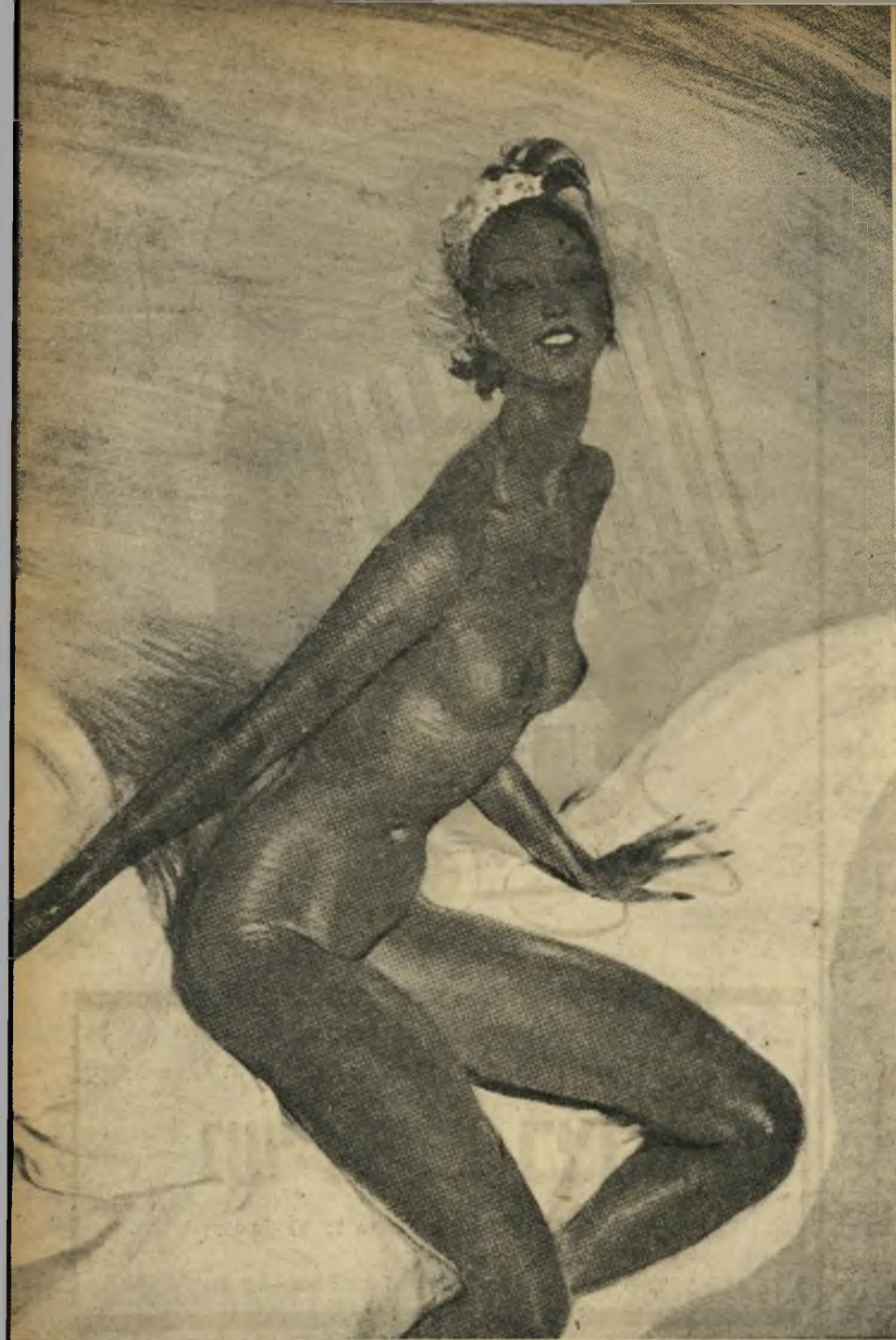
האשה : גופה החטוב להפליא של ג'וזפין העלה אותה לאורות הבמה, תוך הצלחה מלאה החזיקה באור הזרקורים בכל חלקי העולם למעלה מ-25 שנים רציפות.