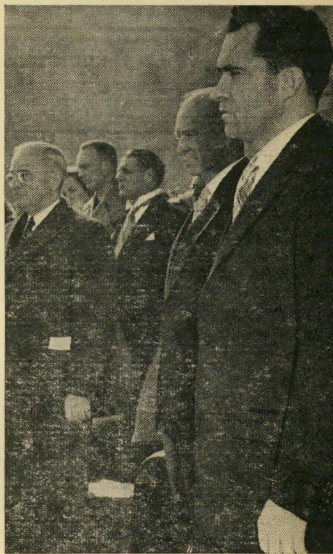
הרגע ההיסטורי: טרומן (שמאל) מעביר רשמית את השלטון לאייזנהואר וניקסון (ימין) — המעמד המסמל את השינוי הקיצוני של המדיניות האמריקאית כלפי ישראל.