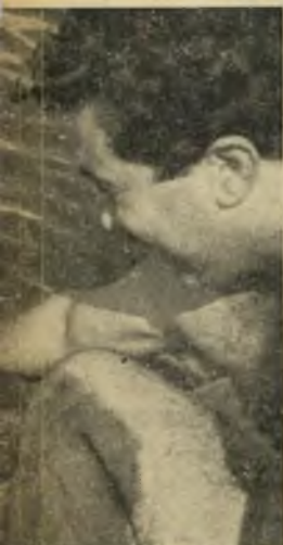
איכלו משהו. עדנה מקב נתחב ישר לתוך פיה, מבלי ש של המשחה אכלו השחיניות ש