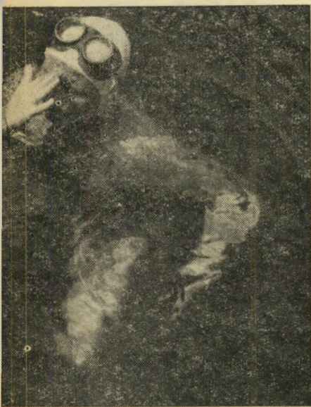
רבש מתוך צנצנת שותה עדנה תוך כדי שחי אינו מכביד על הקיבה. מאחזיכה שוחה מלכה קצובו המשקפיים מכבידים לעתים קרובות, אך אין כמוהם במים על הרשתית העדינה של העין. חשחיינים הישר

הן ארונו את בגדיהם, הכיפות והמש' (המשך בעמוד 18)