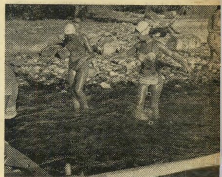
אל הים! בשבע ועשר דקות יורדות השתיים מחוף טבחה, נכנסות לכנרת. המים קרים כמו קרח אולם השחקניות יורדות ללא רתיעה, הן יודעות כי זוהי רק התחלה של המאמץ.

המלצר בבית-הקפה הקטן, ליד המוזן הישן של טבריה לא היה משוכנע כלל. השעה היתה מאוחרת, המוזן היה שומם מאד, וכל לקוחות נוספים לא נראו לעין. לא היה לו כל טעם להאזין לדבריי-שטות מפי שתי הנערות הצעירות ומלחיהן. "הפ" סיקו למחות אתי ואימרו לי בדיוק מה אתם רוצים," אמר בנימת גניפה, "בשעה כזאת אינני מוכן לשמוע כל סיפור מסורף על שתי נערות, הרוצות לצלוח את הכינרת מצפון לדרום. שום אישה לא עשתה זאת. שום אישה לא תעשה זאת — ובודאי שלא שתיכן!" הוסיף בשלחו מבט מלא על-יגות גברית בשתיים.