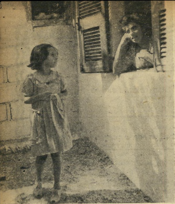
שתי אחיותיו של אחד הנאשמים מספרות כי אחיהם היה ילד ככל הילדים האחרים, אינן רוצות לדבר על מה שקרה בקשר לרצח.