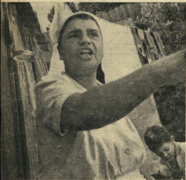
אמו של נאשם אחר מאשימה את "החינוך האירופי". הכוונה לסרטים שהשפיעו על הבנים. "מקודם לא ידענו תופעות כאלה", קראה.