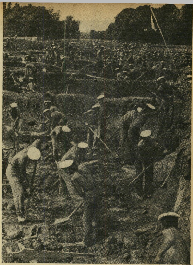
התנדבות המונית. הישראלים היו יכולים ללמוד הרבה מרוח ההתנדבות המפעמת בנוער היוגוסלבי. פעמים מספר בחודש מתפנים אלפי סטודנטים ותלמידי הכיתות הגבוהות של בתי הספר התיכוניים מלימודיהם, לובשים בגדי עבודה, מצטיידים בדגלים אדומים, אתים ומעדרים, יוצאים לחפור תעלות ולסלול כבישים ומסילות ברזל. אחד המבצעים המזוהים של המתנדבים: מסילת הברזל בלגראד-זאגרב, עורקה התחבורה העיקרית של יוגוסלביה.

ליטה לבנות את עתידה בכוחות עצמה ובביקורם בווינה, עיר הש