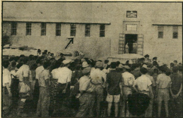
הפגנה מול חזון החשוד: שעה שהנאשם, מאחורי החלון המסומן בחץ, יילל בהיסטריה ופחד, הפגינה תנועות הנוער לפני בנין המשטרה, אותה הן מאשימות ברשלנות וחוסר-פעולה.

האם, חוץ מתלוננות, נקמתם גם באמצעי פיקוח?