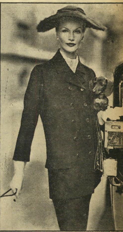
ריקר החליפה הדיוורית מבססת את צללית האשה על האות H, עשויה צמר שחור. ראויים לציון ארוכה הגדול של הזקט, היוצר אפקט של חזה שטוח וגיורה מוארכת, וחוסר כל כריות ריפוד.

התצוגה של באלמיין כוללת גם מעילי ספורט מותא' מים, מעילים ישרים, המצויינים בתגורות על קו'המת' ניים, זקטים רפופים, המגיעים עד קו המותן, ומעילי 7/8