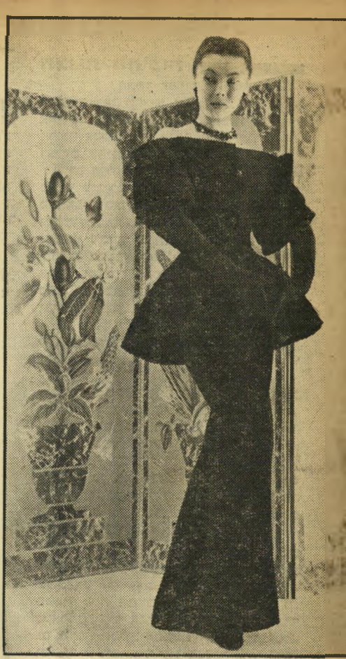
ריקר לבושת'ערב זה העשוי קטיפה שחורה הינו דוגמה נאמנה של האופנה הדיוורית: השרויר לים מונבהים. השמלה כולה צמודה אל הגוף מן הכת' פיים ועד קרהשובל, יוצרת אפקט של תמירות וגובה.

באריגים בהם משתמשים אמני האופנה מתגלה נטייה לחזור אל המקור: אריגי'המשי הינם משיים. רבים מהם עשויים משי טבעי. אריגי הצמר הינם צמריים, קלים ורכים. הצבעים החדשים הם: כחול נודר שגולקח ממכ' חולו של חרמקר, צהוב'אדמדם וזהר, מיוחד לברונטיות, חרוד'אדמדם רומנטי ובלונדיות. כן מרכיב אמנהאופנה