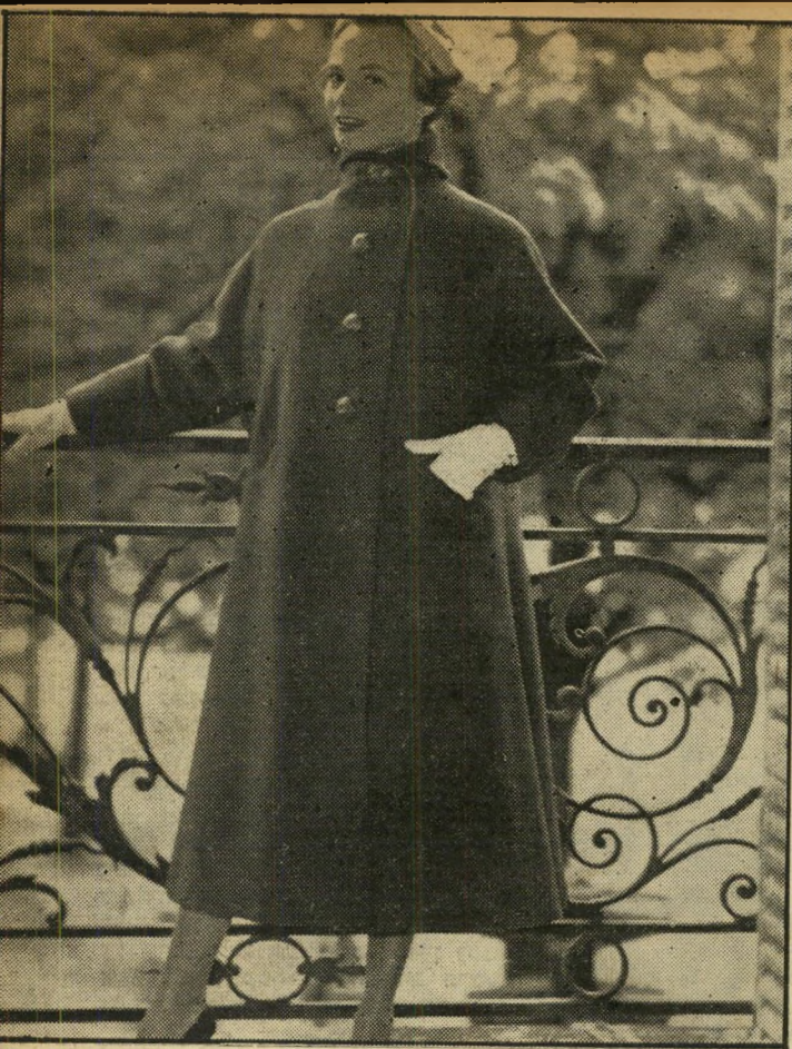
קארונ המעיל האדום, העשוי בד צמרי רך, מסמל את סיגנון המעילים של קארונ, יהמונגד לטינגון שמלותיו ההדוקות, המכונה בשם "כפפה", שולי המעילים רחבים למדי ואריגיהם הרכים יקרים מזכירים לנו את מעילי השליטים המזרחיים במאה ה-18.