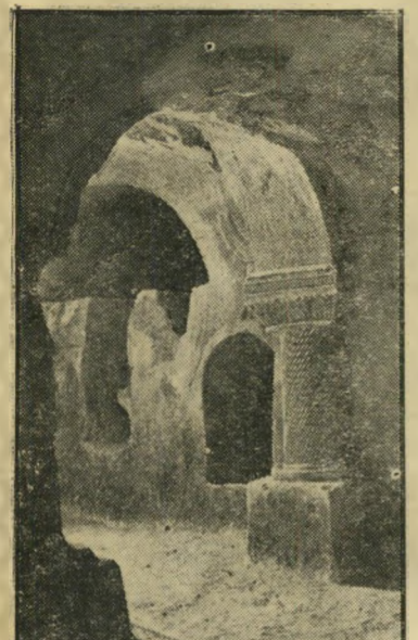
המנהרה האחרונה שנוקתה לאהובת טיטוס, עיר קברות