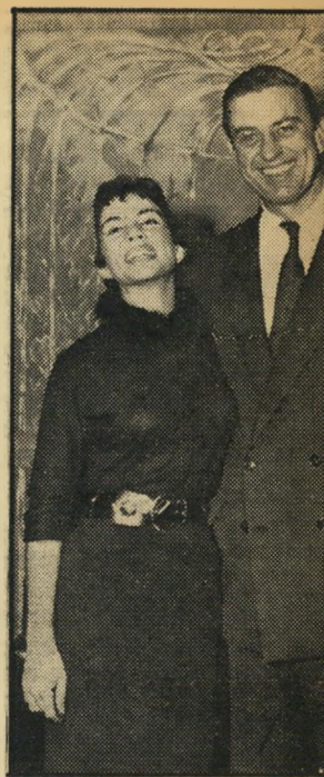
זיהו נשכחה מלבו של פרנקלין דבלט הבן, בנו של נשיא ארצות הברית, שנשכל לאחרונה בבחירות.

החלק החשוב ביותר של עבודתי היה 55 הפגישות עם סוחי היין, אלה היו האנשים אשר ימשיכו למכור את יינות (המשך בעמוד 14)